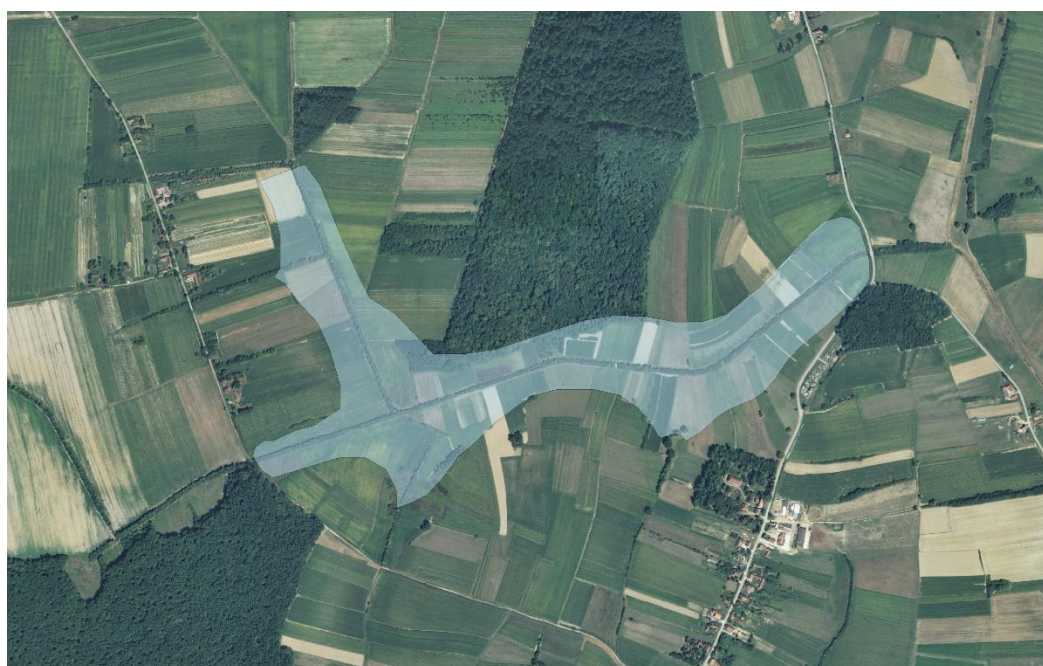
Slika 2. Situacija predviđene akumulacije na vodotoku Cerina